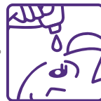
容器の先と 目やまつ毛が ふれることのないように