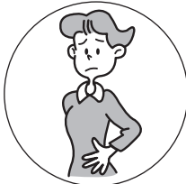
おなか はったときに