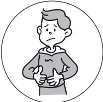
おなかの弱い方の 整腸に