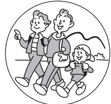
旅行など環境の変化で おなかの調子をくずしたときに